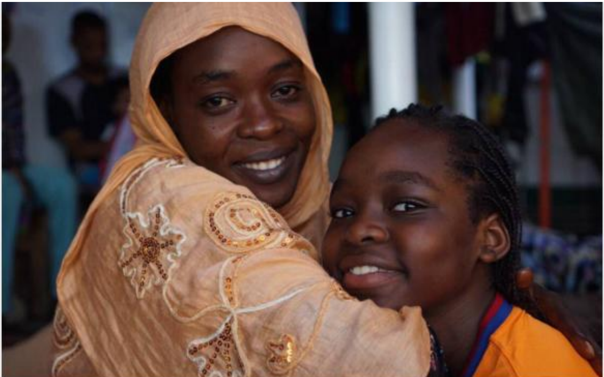
Safa y su hija, a bordo del 'Open Arms'. FRANCISCO GENTICO